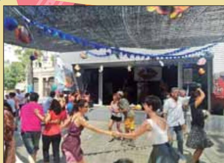
Impresentable Swing FM Day