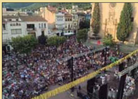
Pregó del Cor Sarabanda