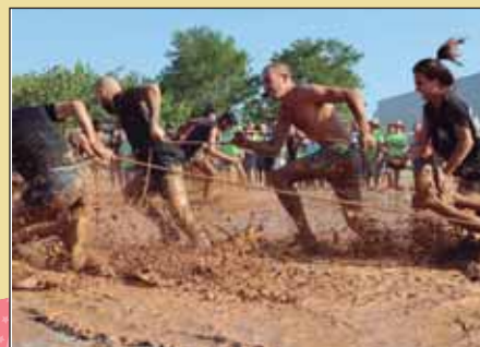
L'esgarrinxada, tot un clàssic