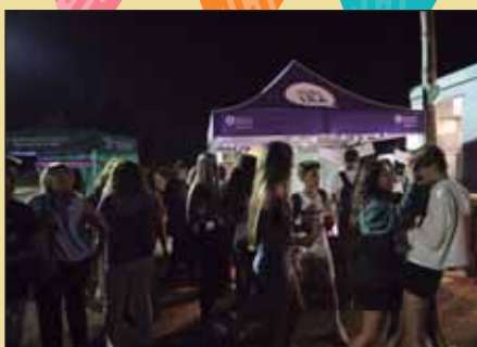
Punt Lila: Festa Lliure, Fest-te Lliure!