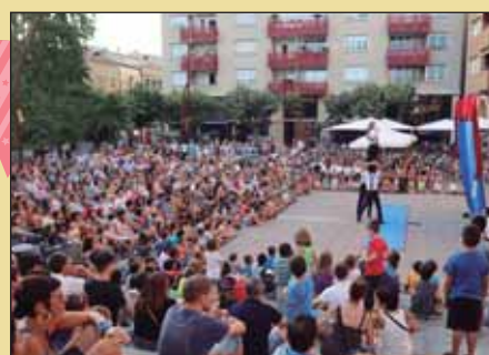
Espectacle de circ a la plaça