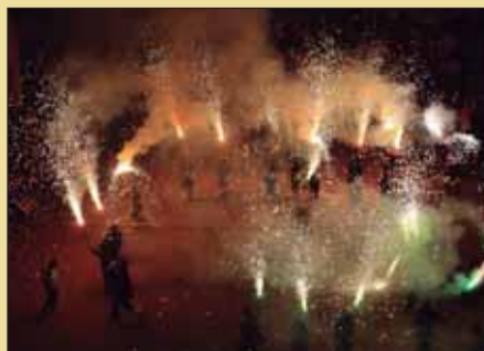
El correfoc del Front Diabòlic