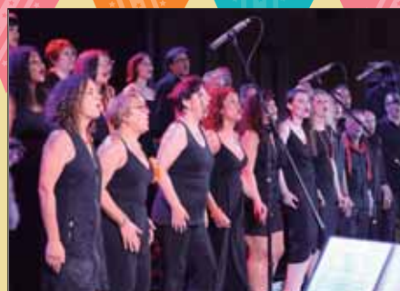
Concert de Gospel Joy la Garriga