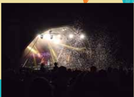
Concerts a l'Espai Nits la Doma