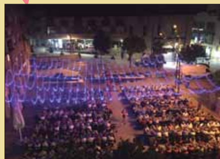
Sopar de Festa Major