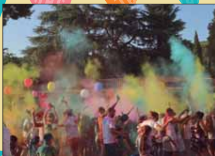
Explosió de colors a la Holi Festival