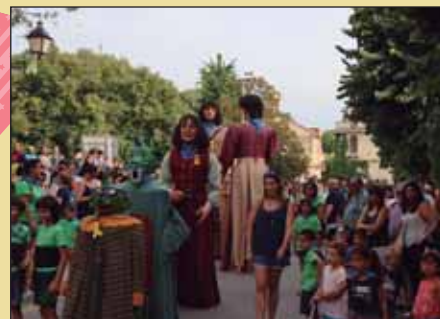
Cercavila d'inici de festa

foc i d'aigua, sardanes, cercaviles, jocs infantils... Un any més, van ser milers les persones que van voler participar de la festa més intensa del municipi, i que van animar-se a gaudir dels diferents actes programats, tant de dia com de nit, en un munt d'escenaris i espais diversos.