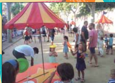
Tardes de jocs infantils al Passeig