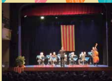
Presentació CD "Sardanistes garriguencs"