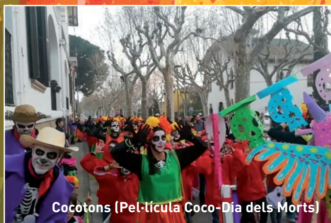
Cocotons (Pel·lícula Coco-Dia dels Morts)