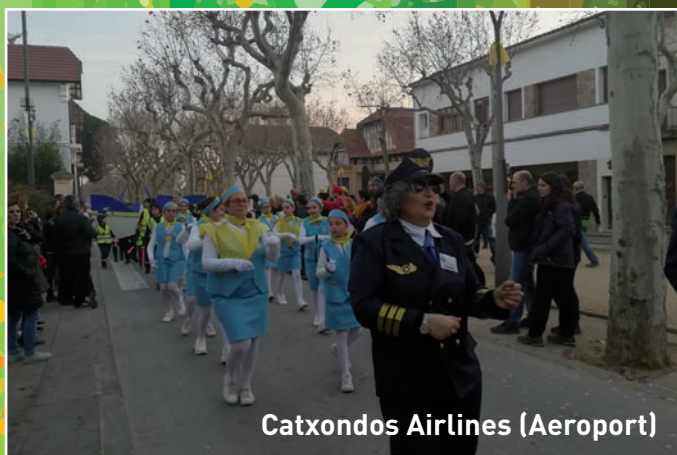
Catxondos Airlines (Aeroport)