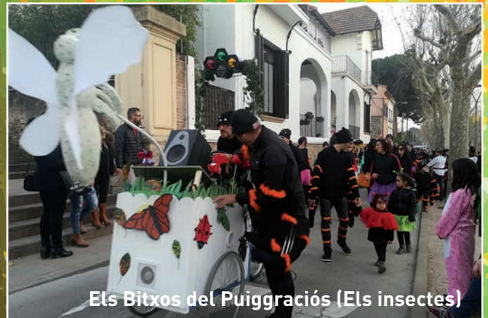
Els Bitxos del Puiggraciós (Els insectes)