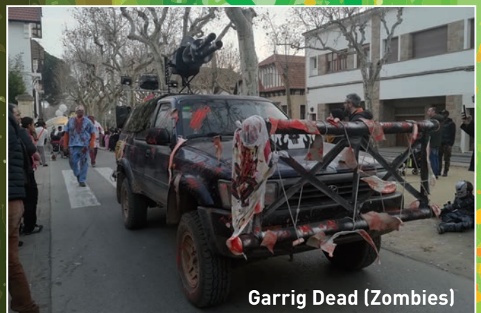
Garrig Dead (Zombies)