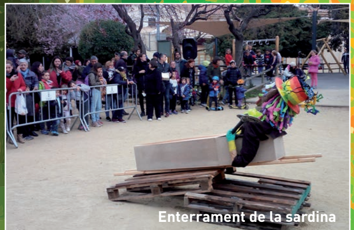
Enterrament de la sardina