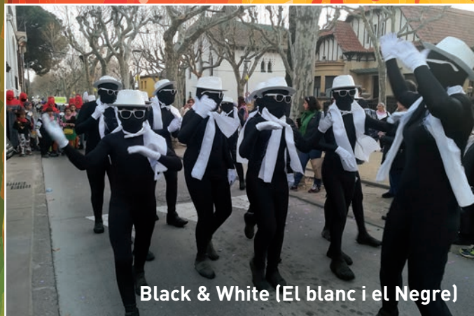
Black & White (El blanc i el Negre)