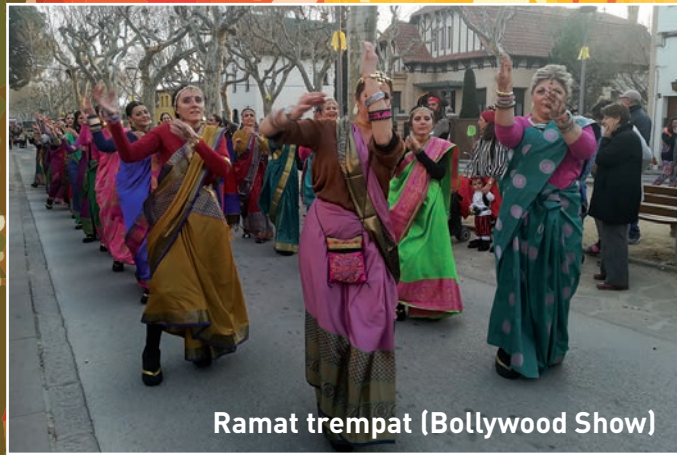
Ramat trempat (Bollywood Show)