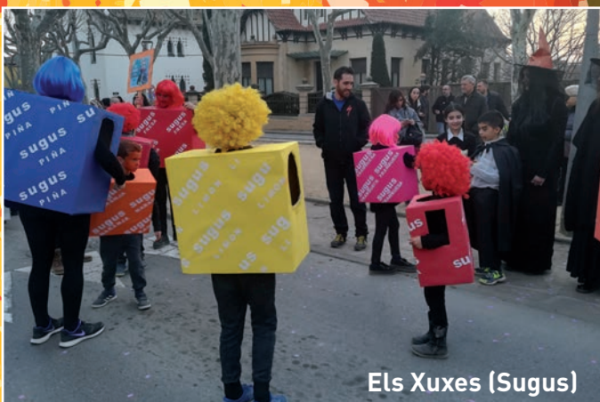
Els Xuxes (Sugus)