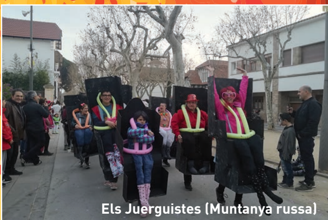
Els Juerguistes (Muntanya russa)