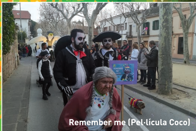
Remember me (Pel·lícula Coco)