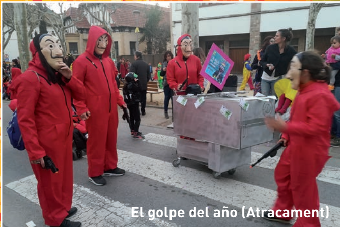
El golpe del año (Atracament)