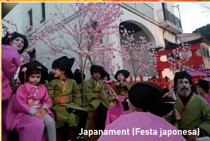
Japanament (Festa japonesa)