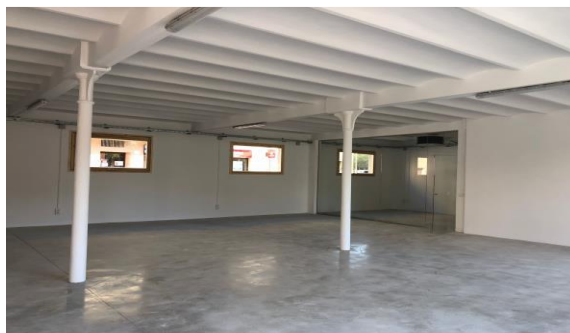
Fotografia de la sala polivalent

Dins de les diferents sales està previst que hi hagi diferents zones: