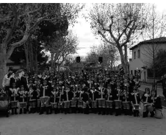
2n premi de la categoria A Els Aviadors, de Top Gun Giroi