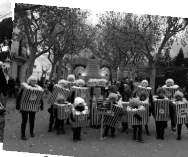
3r premi de la categoria B Les Crispetes