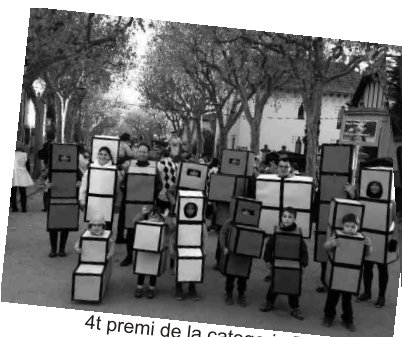
4t premi de la categoria B Los Piezas