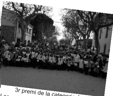
3r premi de la categoria A Les emocions, d'Inside Out Pinetons