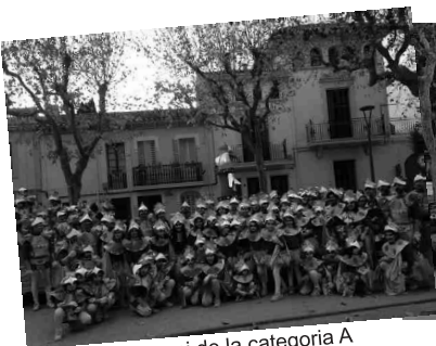
1r premi de la categoria A Els Guerrers Ocell, de Volats del Taga

l'escenari a fer el seu ball. L'endemà, 7 de febrer, l'enterrament de la sardina i la crema del Rei Carnestoltes a la plaça del Silenci, van cloure la festa del Carnaval a la Garriga.