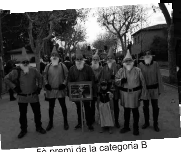
5è premi de la categoria B Blancaneus i els set nans