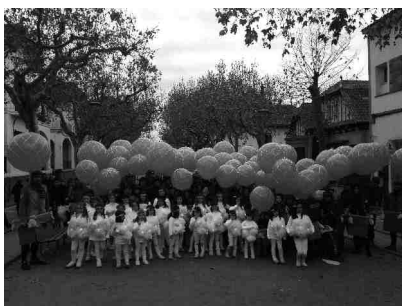
1r premi de la categoria B Pels aires, del Ramat Trempat