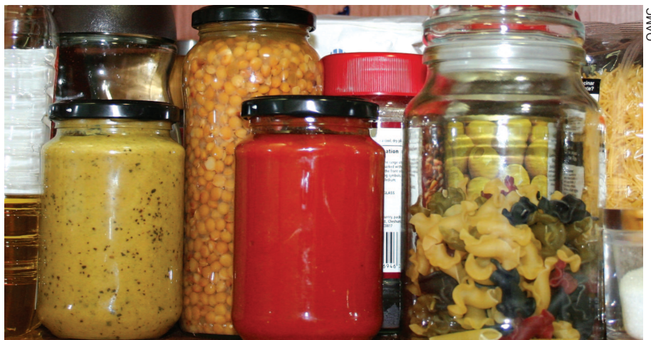
Unes 120 famílies fan servir de manera continuada el Banc d'Aliments de Càritas.

despeses és, sens dubte, una de les realitats més preocupants per a una part de la població i, en aquest sentit, és especialment rellevant la tasca del Banc d'Aliments de Càritas. A dia d'avui, són més de 120 les famílies que fan servir el Banc d'Aliments de manera continuada.