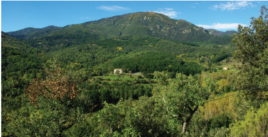
S'estudia ampliar el límits de la reserva de l'espai natural

La Garriga és un dels pobles que passaria a ser part de la Reserva de la Biosfera del Parc Natural del Montseny, si el parc s'ampliés. Des del Parc Natural s'està treballant per aconseguir ampliar els límits de la declaració de la reserva