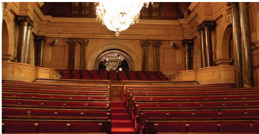
Parlament de Catalunya

El Parlament és la institució que representa el poble de Catalunya i està format per una sola cambra independent