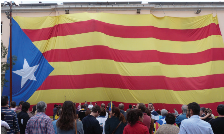
La façana de l'Ajuntament, totalment coberta.

Un públic molt nombrós es va reunir el passat 14 d'octubre a la plaça de l'Església per veure com es despleguava l'estelada més gran del món. En el marc de la Festa de l'Estelada, un acte organitzat per l'Assemblea Nacional Catalana de la Garriga (ANC), es va penjar una enorme bandera de la façana de