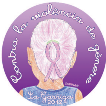
Simbol de l'edició d'aquest any

L'Ajuntament, conjuntament amb les entitats i la societat civil, torna a aprofitar la data del 25 de novembre, Dia internacional contra la violència envers les dones, per manifestar, una vegada més, el rebuig a la violència masclista.