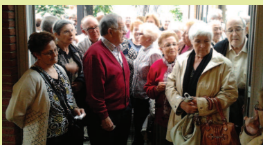
Àrea d'Acció Social

El mal temps no va impedir que es celebrés el Dinar de la Gent Gran, que aquest any es va traslladar a l'interior de l'Auditori. La festa, que es va fer el 21 d'octubre, va comptar amb la participació d'un centenar de persones de la Garriga, i també de Cànoves i Samalús, ja que l'activitat s'organitzava conjuntament entre els dos municipis.