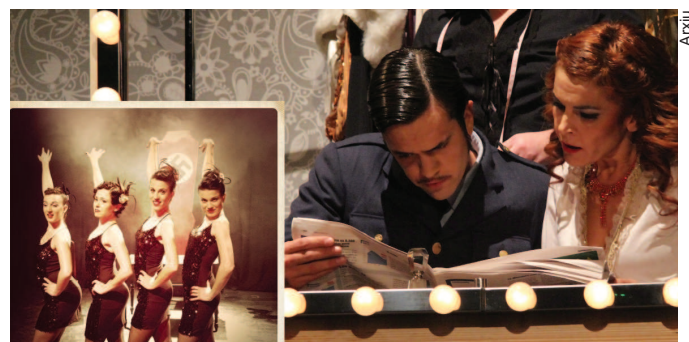
The imprementable weekend vol ser un punt de trobada pels amants del ball.

La Garriga ballarà a ritme de swing el cap de setmana del 10 i 11 de novembre amb l'organització de diversos tallers, concursos i concerts a la pista núm. 1 i amb l'obra de teatre Ser o no ser que es farà al Patronat. Tot plegat permetrà a la ciutadania traslladar-se al món d'aquest gènere musical dels anys 20 i 30.