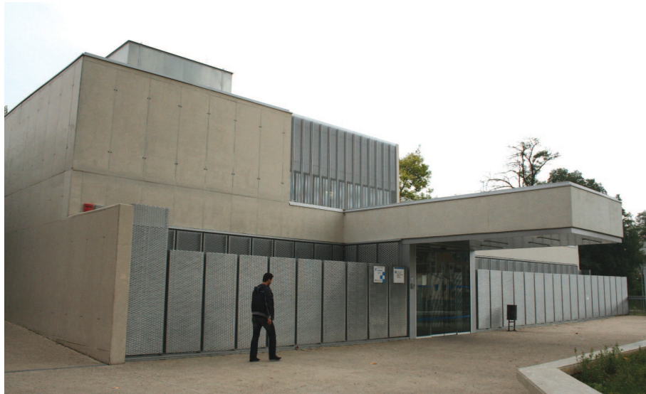
Les persones usuàries podran ser ateses en horari nocturn, almenys tot el 2012