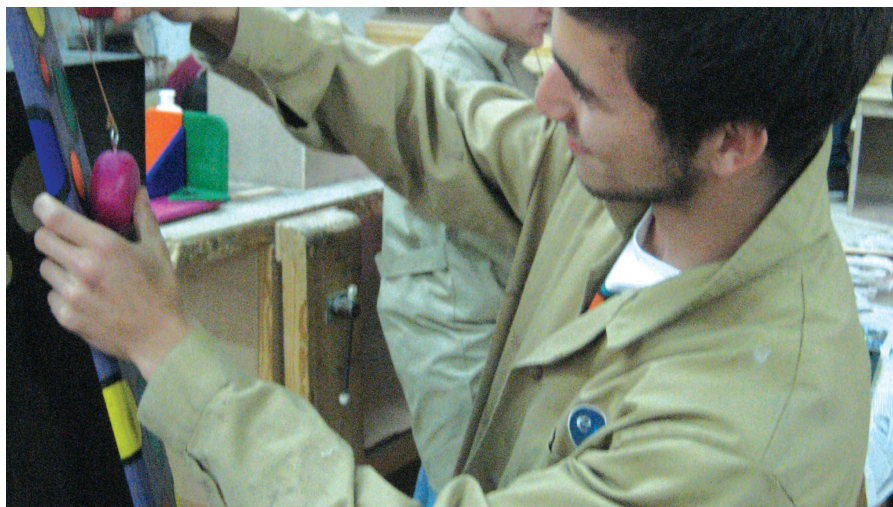
El govern de la Garriga ha desmentit el tancament de l'EMAD

Respecte a l'EMAD, ja s'han aprovat els preus públics de tots els cicles formatius i tallers que es realitzen i, per tant, l'alumnat ja pot fer la seva matrícula tal com estava previst. De fet el professorat ja està planificant el curs vinent.