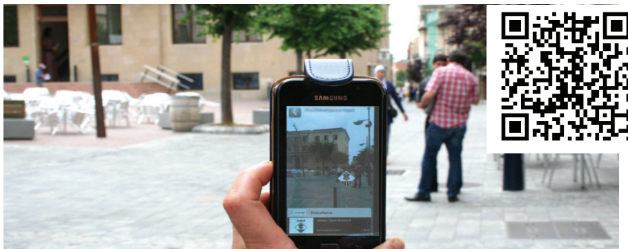
L'aplicació permetrà, a la llarga, rebre les novetats dels equipaments municipals

La Garriga compta des del passat mes de juny amb una aplicació per a mòbils que permet localitzar els equipaments municipals a través de la tècnica de realitat augmentada.