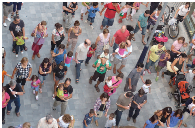
La Comissió vol que la ciutadania surti al carrer per disfrutar de la més de seixanta activitats programades per la Festa Major

Un any més les entitats tindran un paper clau en l'organització i desenvolupament de la Festa Major, que enguany es farà del 2 al 5 d'agost. La tasca de la Comissió de Festa Major i l'esforç econòmic de l'equip de govern han permès poder seguir organitzant un programa d'activitats variat i per a totes les edats.