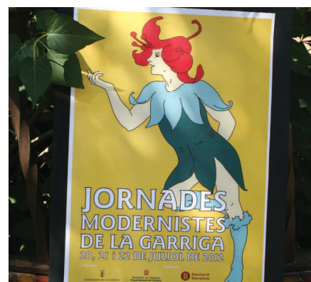
Moltes de les activitats es duran a terme en espais vinculats al modernisme d'estiueig, com la Torre Domingo Pujadas. El cartell, obra d'Adrià Bas.

La Garriga celebra els propers 20, 21 i 22 de juliol les Jornades Modernistes, un esdeveniment inèdit obert tant al conjunt de la població com a professionals de la cultura i el patrimoni. A través de les Jornades Modernistes de la Garriga es vol reflexionar sobre aquest moviment cultural, que durant els primers anys del segle XX va abastar totes les arts i que va incidir, de manera molt singular, en l'arquitectura.