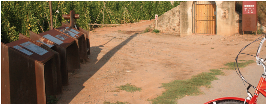
L'itinerari inclou l'entrada al refugi antiaeri de can Sorgues, ubicat al camp

Fer una ruta guiada amb bicicleta pel camp d'aviació de Rosanes en grups d'entre 10 i 20 persones, tot gaudint de les explicacions de guies experts i descobrint un part del passat de la història del nostre país. Aquesta és una de les propostes que el Centre de Visitants de la Garriga posa a l'abast de la població per als mesos de juliol i agost, a través de l'empresa Arkpadoc SC.